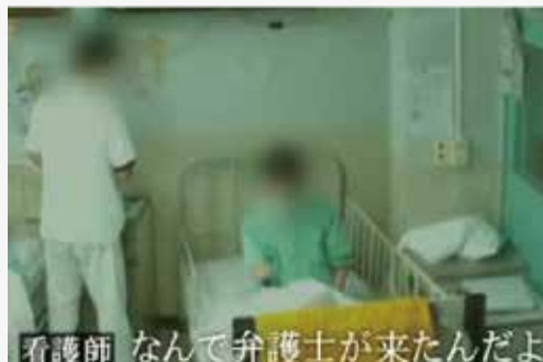
看護師 なんて弁護士が来たんだよ

准看護師A: すいませんじゃねえよ! 日本語わかんねえのか? オラ! 看護師B: また泣くのか? 泣いたらゲンコツで叩くぞ、お前! しきりに謝る患者と居丈高な職員。。。右のような映像と声が、日本の精神病院の現実を露わにし、視聴者に衝撃を与えました。取材班は、1498人10年分の患者リストを入手し、それをもとにした緻密な分析を展開しました。たとえば、1498人の78%にあたる1174人が死亡退院であること、カルテと診療内容を照合すると、不必要・不適切な診療が行われていたこと。身体拘束が日常のおこなわれているにもかかわらず、東京都の監査では「A」と評価されていること……。